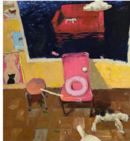
backup (another reality), 2024 Öl auf Leinwand, Keilrahmen 140 x 130 cm