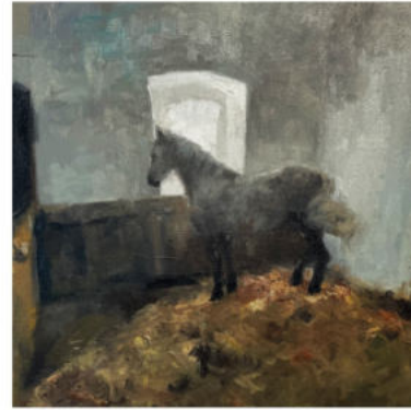
Pegasus , 2024, Öl auf Leinwand Keilrahmen, 30 x 30 cm

Ein zentrales Element der Ausstellung ist das großformatige Bild eines Pferdes mit angedeuteten Flügeln, das die Traumvorstellung von Entkommen und das Wunder des Negierens der Schwerkraft verkörpert – ein Hilfsmittel zur Flucht und Freiheit. Der schemenhaft skizzierte Flügel symbolisiert ungenutztes Potenzial und kreative Sehnsucht. Begleitend dazu wird ein kleines Bild präsentiert, das einen Ausschnitt des großformatigen Werkes zeigt. Es wird die Frage nach dem Detail und dem Gesamtbild aufgeworfen: Wie formen diese Bruchstücke unser Verständnis von uns selbst und der Welt?