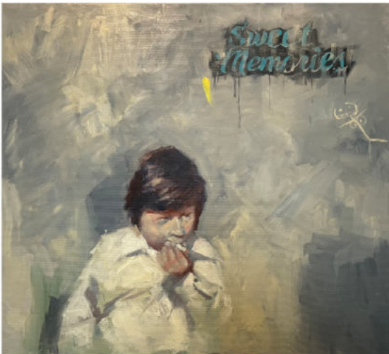
can't repeat , 2024 Öl auf Leinwand, Keilrahmen 81 x 90 cm