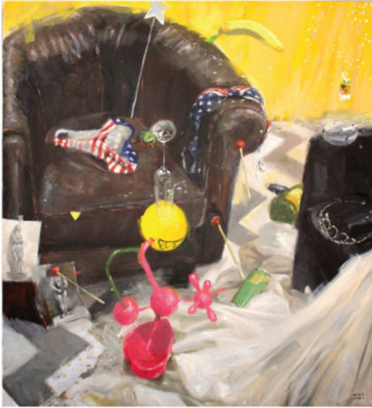
Candyland , 2021 Öl auf Leinwand, Keilrahmen 110 x 120 cm