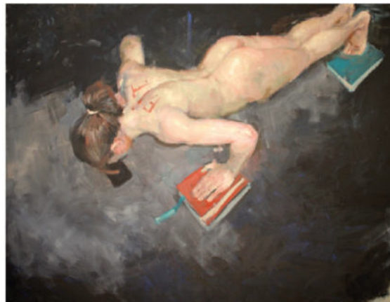
F.i.t., 2024 Öl auf Leinwand, Keilrahmen, 130 x 170 cm