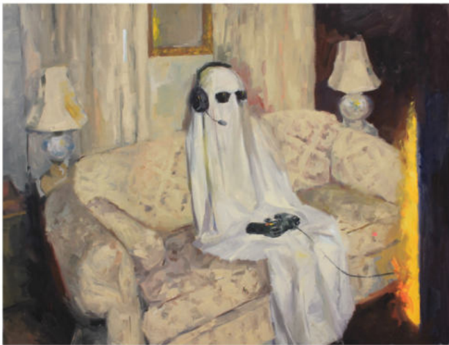
Ghosting, 2024 Öl auf Leinwand, Keilrahmen, 130 x 170 cm