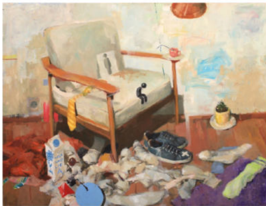
seven miles away, 2021 Öl auf Leinwand, Keilrahmen, 130 x 170 cm